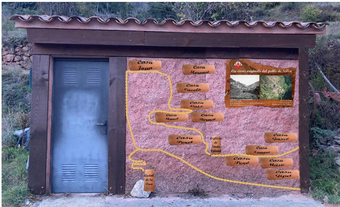
DALT: Muntatge del mural de teules de les cases col·locades configurant el poble de Sellui i cartell amb les fotografies BAIX: Muntatge del mural de fusta de benvinguda al com d'aigua d'entrada al poble

Per tant, tot plegat esdevindrà una obra d'art de benvinguda al poble , on el visitant o amic que visiti per primer vegada Sellui, només arribar al poble pugui comprendre amb una mirada ràpida i creativa tot el seu conjunt i el patrimoni que presenta .